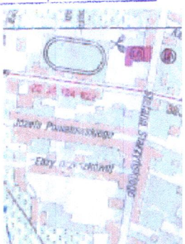
ORIENTACJA SKALA 1 : 20000

KIEROWNIK REFERATU mgr inż. Dariusz Kubala